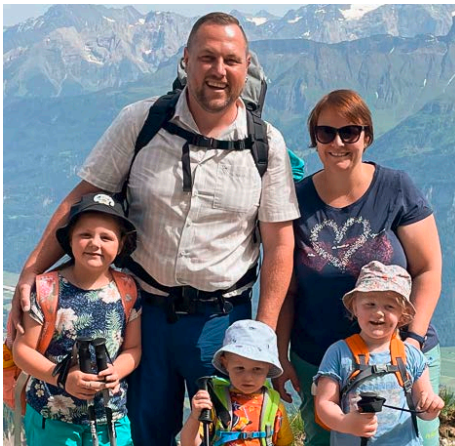
Oben links: Familie B. aus dem Entlebuch wünscht sich zu Weihnachten einen gemeinsamen Zooeintritt (Zürich oder Basel).

Bei den hier abgebildeten Familien handelt es sich nur um einige wenige unter vielen anderen, denen wir ebenfalls eine Weihnachtsfreude bereiten möchten. Mit Ihrer Adventsspende unterstützen Sie deshalb auch Hunderte von Familien, die hier nicht abgebildet sind. Vielen, vielen Dank für jede Gabe!