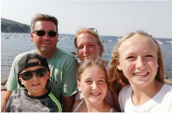
Familie G. aus dem Kanton Aargau mit ihren drei Kindern wünscht sich zu Weihnachten einen neuen Fernseher:

«Ab und zu geniessen wir einen gemeinsamen Fernsehabend. Nachdem unser alter Röhrenfernseher durch den alten Flachbildfernseher des Grossvaters ersetzt wurde, ist nun auch dieser am Ende der Laufzeit. Das Bild spinnt ab und zu. Der Ton ist schlecht hörbar und die Bildqualität aufgrund der alten Technik auch nicht die Beste.»