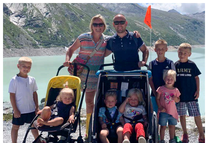
Oben links: «Ein Schlitteltag für die ganze Familie würde uns sehr freuen», schreibt die Zürcher Familie G.