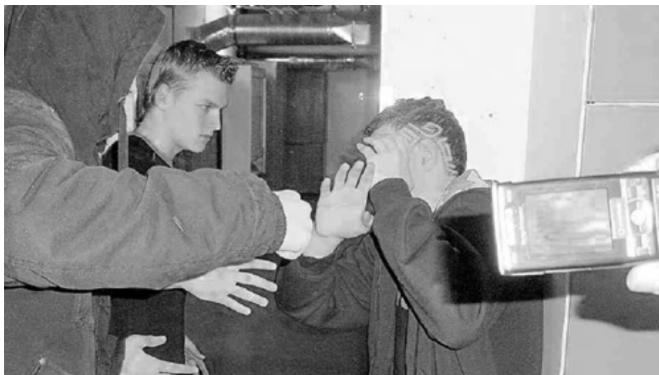
Beim «Happy slapping» werden Gewaltakte mit dem Handy gefilmt und weiterverbreitet.

Relativierend ist die Studie des Bundesrates auch, was Gewalt in den Medien angeht. Dies betrifft beispielsweise Videogames, die aus der Ich-Perspektive gespielt werden. Damit entsteht ein Simulatoreffekt und es wächst die Gewöhnungsgefahr, wodurch Gewalt auch im realen Leben als Mittel zur Konfliktlösung subjektiv zunehmend legitim er-